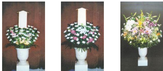
①生花1段(1基) 12,500円(税込) ②生花1段(1基) 18,500円(税込) ③生花1段(1基) 25,500円(税込)