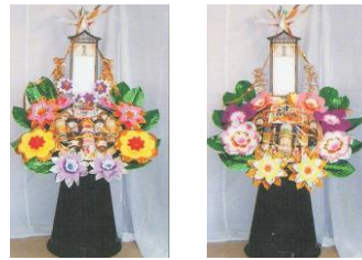
⑤缶詰盛籠(1基) 20,500円(税込) ⑥缶詰盛籠(1基) 25,500円(税込)