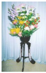
④造花3本足型(1対) 25,500円(税込) 高さ120cm